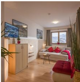
1-4 Personen · 1 Slaapkamer

50 m 2 grote, niet rokers-appartementen, keuken compleet ingericht. Slaapkamer, douche/wc, kabel-tv. Woon-slaapkamer met 10 m 2 groot terras op het zuiden.